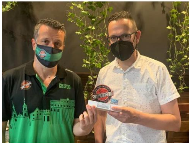
Club Baloncesto San Fernando 30 julio 2021

Colaboramos con el Club Baloncesto San Fernando , desde las categorías bases al equipo liga EBA, mucha suerte para la nueva temporada # rsc # baloncesto # deportebase # naval # exitos